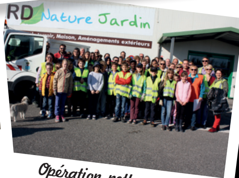
Opération nettoyage de printemps le 8 avril 2017