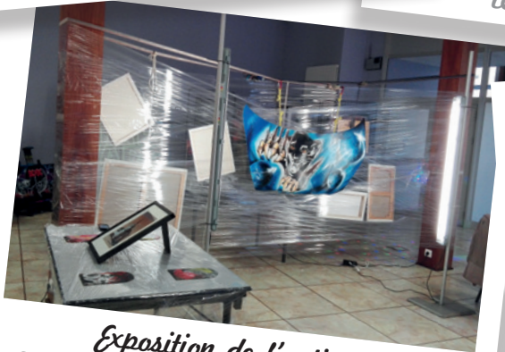
Exposition de l'artiste Thierry Ragobert à la salle l'Expo du 8 au 22 avril 2017