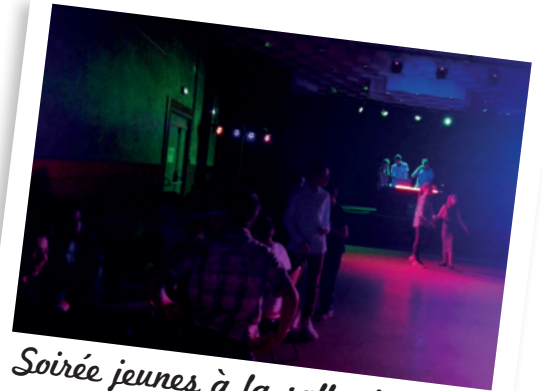
Soirée jeunes à la salle des fêtes animée par « Sdj&Droops » le 31 mars 2017