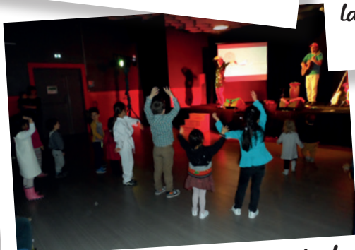
« Le bal de Bouh », spectacle enfants de la saison culturelle le 3 mai 2017