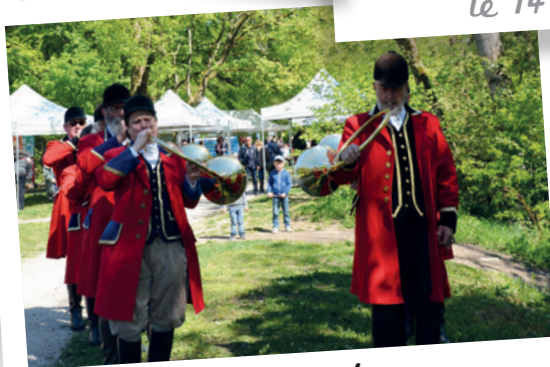
3 e édition de la « Journée Jardin au Journans » le 30 avril 2017