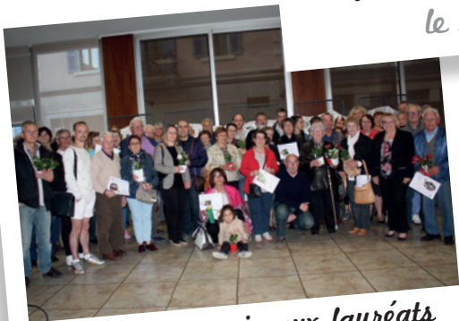
Remise des prix aux lauréats du fleurissement 2016 le 6 avril 2017