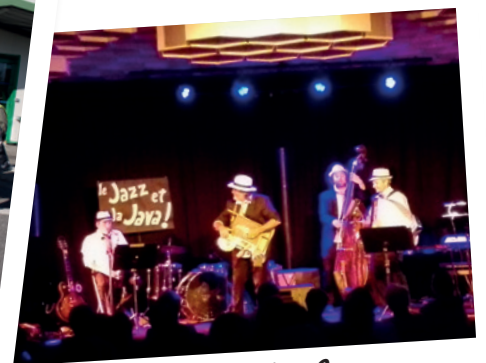
« Le Jazz et la Java », concert de la saison culturelle le 14 avril 2017