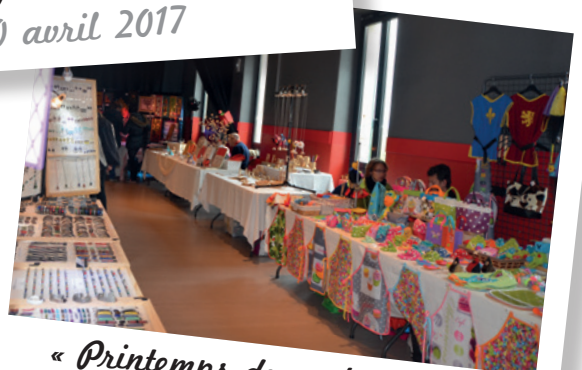
« Printemps des créateurs » à la salle des fêtes les 7 et 8 mai 2017