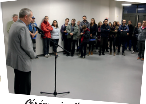
Cérémonie d'accueil des nouveaux arrivants le 6 octobre 2016