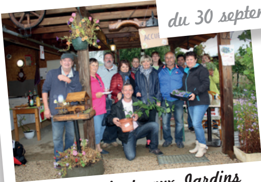
1 er Troc-plants aux Jardins Familiaux impasse des jardiniers le 1 er octobre 2016