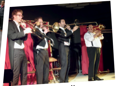
Soirée culturelle avec « Moya Trombones Show » le 8 octobre 2016