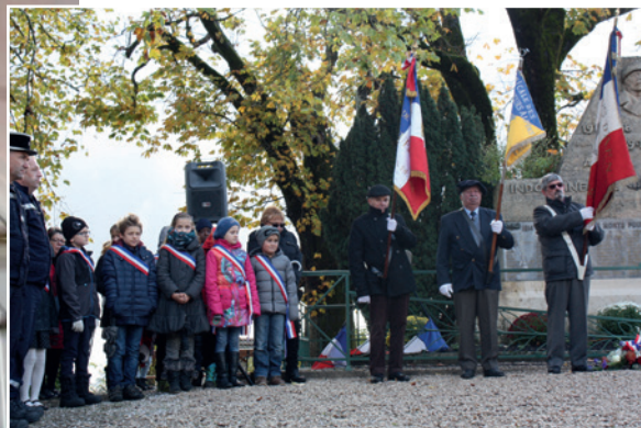
Commémoration du 11 novembre