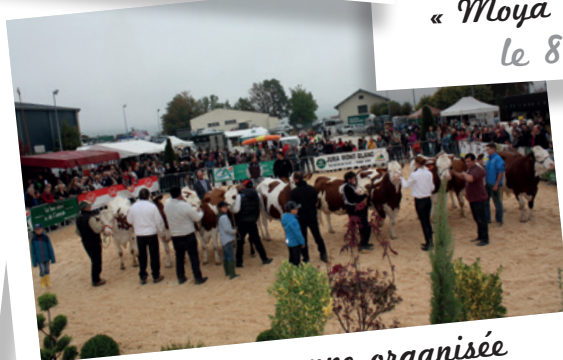
Journée paysanne organisée par les Jeunes Agriculteurs du Pays de Gex à l'espace Perdtemps le 23 octobre 2016