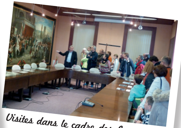
Visites dans le cadre des Journées du Patrimoine sur le thème « Patrimoine et citoyenneté » les 17 et 18 septembre 2016