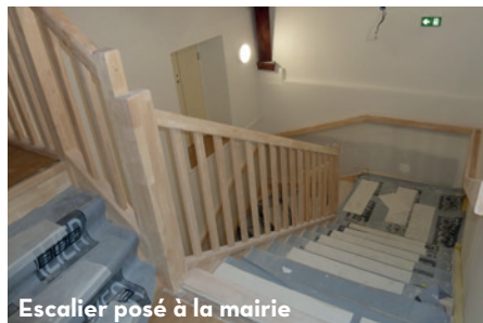
Escalier posé à la mairie

Les travaux d'accessibilité sont en partie achevés. Fin octobre, l'Accueil et le service Vie quotidienne ont emménagé dans leurs locaux rénovés. Les services Comptabilité et Ressources humaines se réinstalleront plus tard. Un ascenseur permet d'accéder au service Vie quotidienne au 1 er étage et au 2 nd aux archives ainsi qu'à un espace pouvant servir, dans le futur, de salle de conseil. Un escalier a également été posé, reliant le 1 er étage aux archives. Celles-ci bénéficieront désormais d'un espace adapté, les archives anciennes seront conservées dans un local à la température et au taux d'humidité