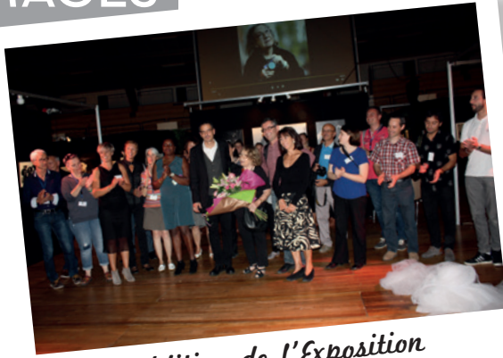
4 e édition de l'Exposition Confrontations de la Photographie à l'espace Perdtemps du 30 septembre au 2 octobre 2016