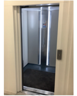
Ascenseur en mairie