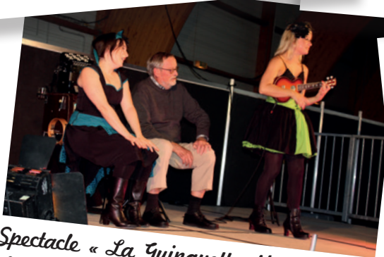
Spectacle « La Guinguette déglinguée » offert par le CCAS dans le cadre de la Semaine Bleue à l'espace Perdtemps le 13 octobre 2016