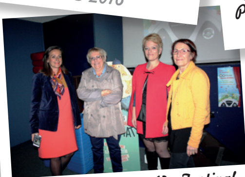
Inauguration du 13 e Festival P'tits Yeux Grand Écran du 19 au 30 octobre 2016