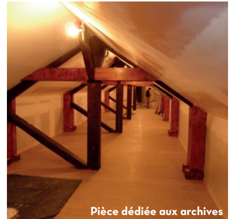
Pièce dédiée aux archives

contrôlés. La salle des fêtes est aussi achevée, un ascenseur permet d'y accéder et des toilettes pour personnes à mobilité réduite (PMR) ont été aménagées.