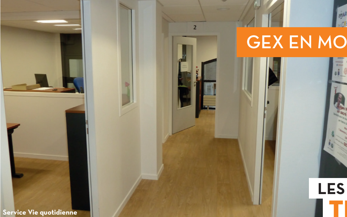
Service Vie quotidienne