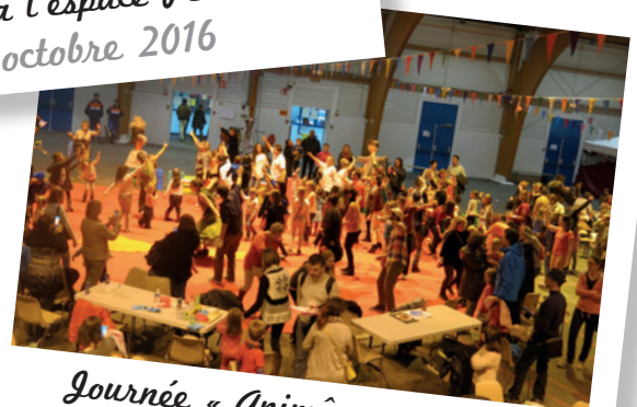
Journée « Animômes » pour les enfants et leurs familles à l'espace Perdtemps le 5 novembre 2016