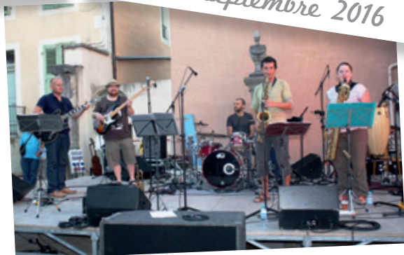
2 ème édition de « Gex'L en musique » le 10 septembre 2016