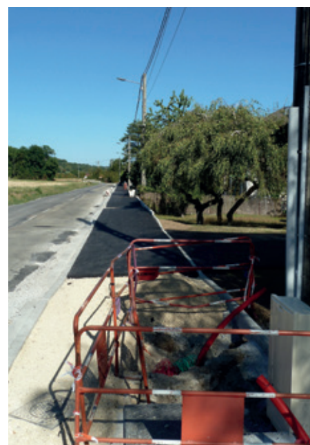
Rue de l'Oudar

Les travaux de voirie rue du Creux du Loup sont quasiment terminés. L'ensemble des réseaux aériens est maintenant déposé.