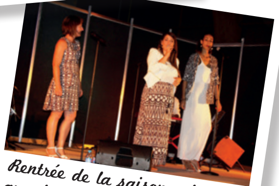
Rentrée de la saison culturelle avec le trio « Ananda Gospel » le 9 septembre 2016