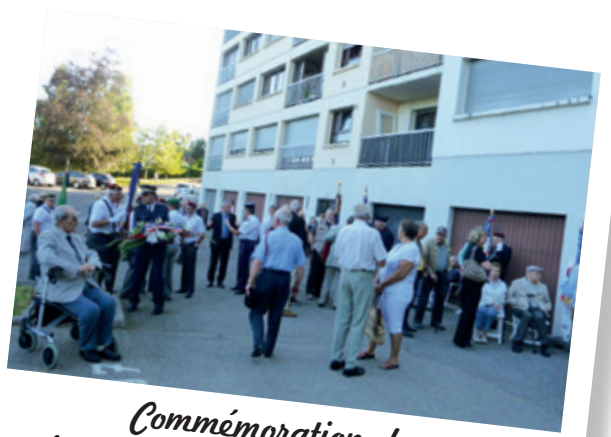
Commémoration de la libération de Gex à la stèle Alexandre Reverchon le 21 août 2016