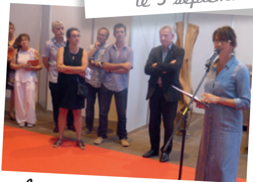
Inauguration du 1 er Salon des Métiers d'Art à Gex le 9 septembre 2016