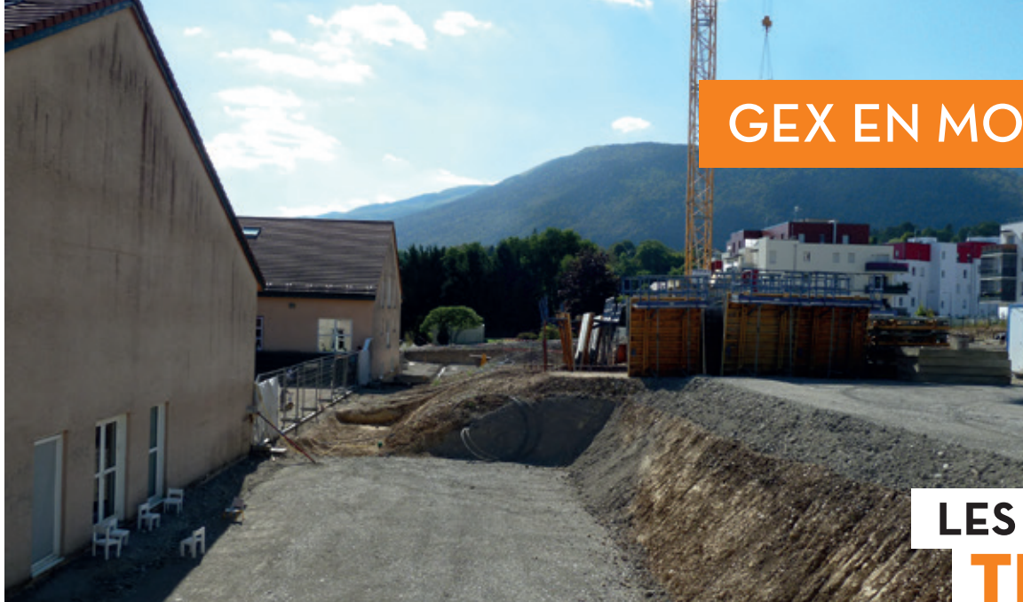
Groupe scolaire Parozet