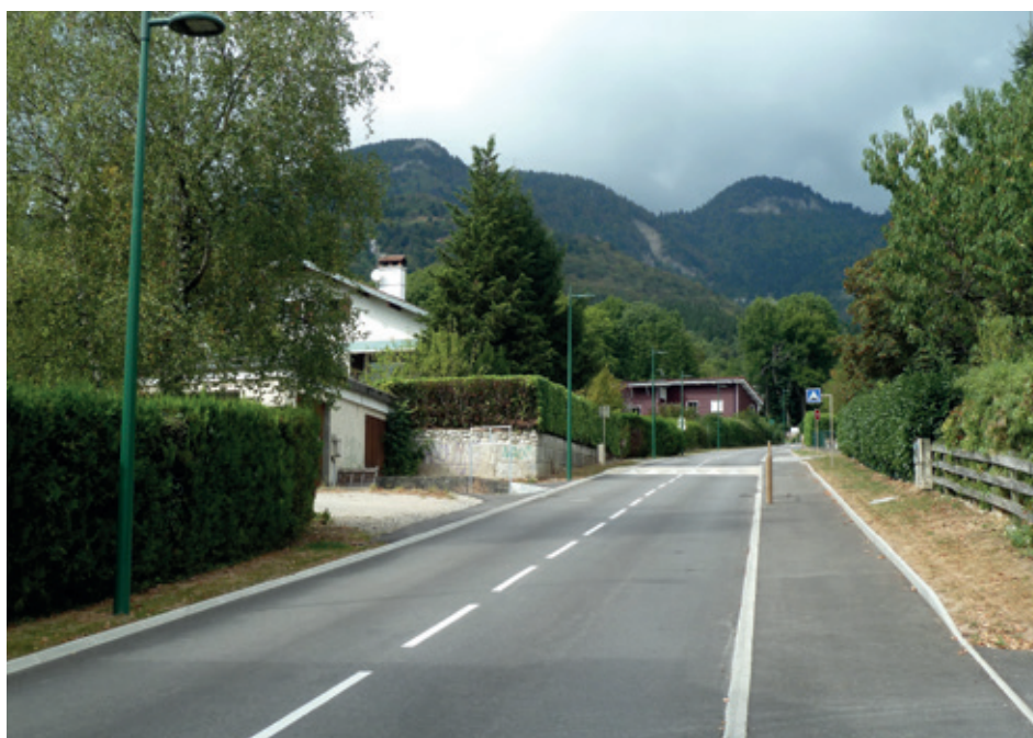
Rue du Creux du Loup