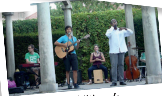
2 ème édition de « Scène libre musicale » au Parc des Cedres le 27 août 2016