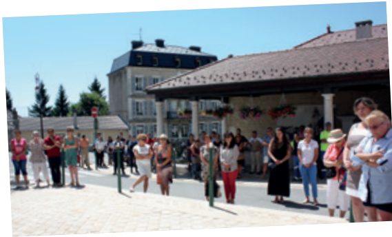
Recueillement et minute de silence devant la mairie en mémoire des victimes de l'attentat de Nice du 14 juillet le 18 juillet 2016