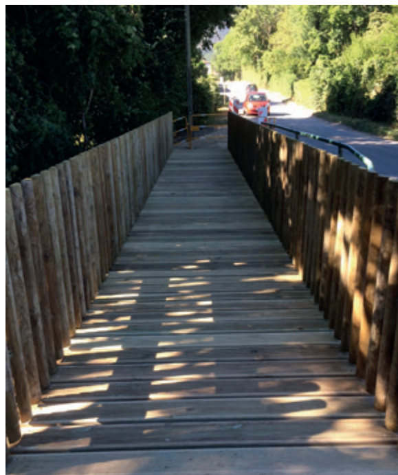
Passerelle au-dessus de l'Oudar

La passerelle au-dessus de l'Oudar sur la route en direction de Pitegny a été posée et finalisée début septembre. Elle doit permettre aux piétons de se déplacer en toute sécurité vers le stade de Chauvilly.