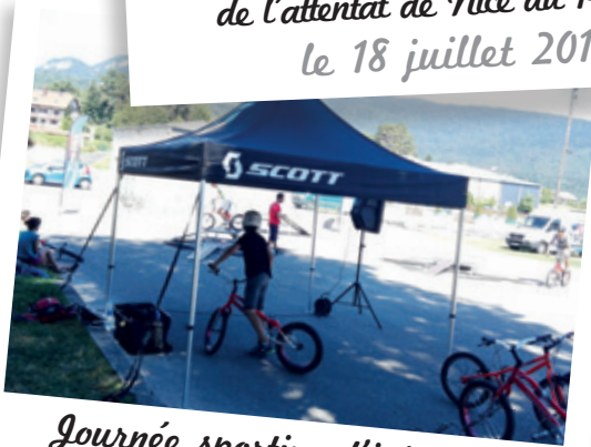
Journée sportive d'initiation au Utt trial le 26 août 2016